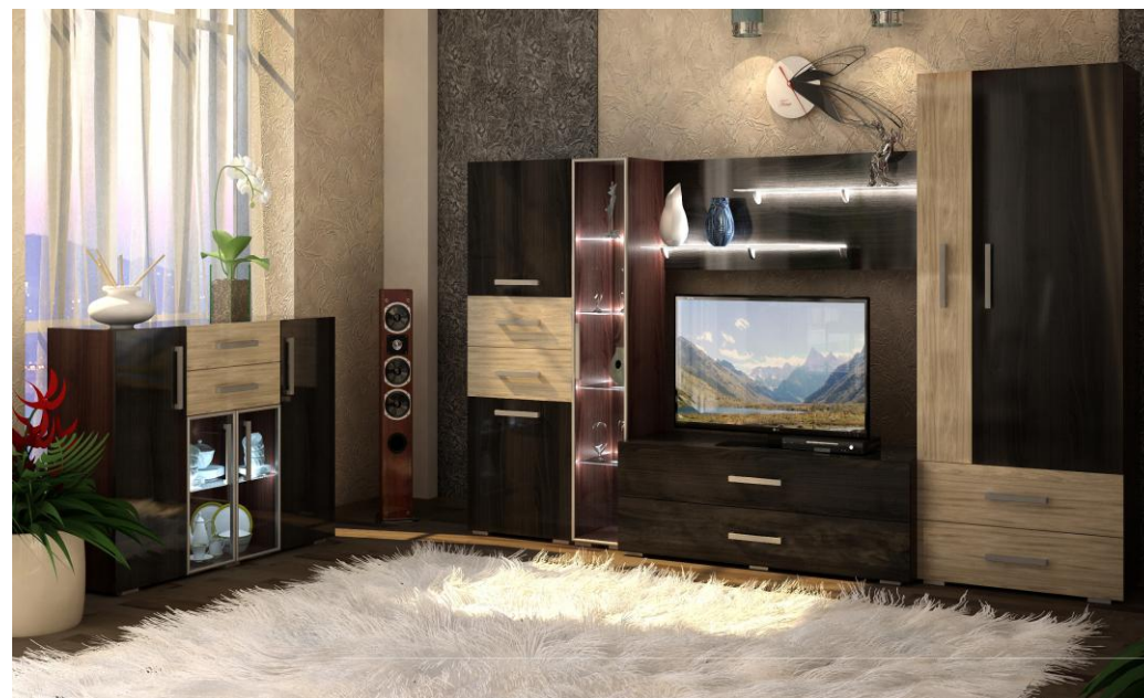
Рис.1 Общий вид горки «Капучино».